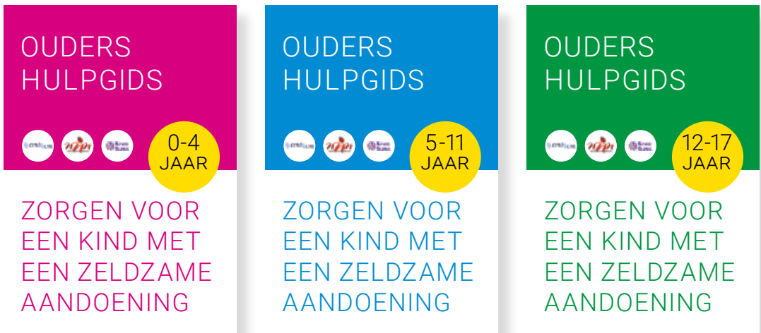
Brochures ouder ondersteuningsgids

Wij hebben in samenwerking met ERN-skin (Eurordis) de ouder ondersteuningsgidsen uit het Engels vertaald naar het Nederlands. Deze praktische en ziekte onafhankelijke informatie helpt ouders van kinderen een zichtbare huidafwijking. Deze brochure kan worden 'gedownload' van onze website. In 2022 gaan wij de brochure laten drukken en verspreiden via de multi disciplinaire CMN poli's.