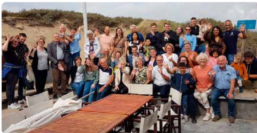
Ledenconferentie 2021 in Nederzandt